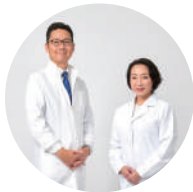
現役の栄養療法医師と 管理栄養士がサポート