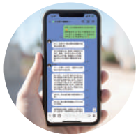
LINEの オープンチャットを使用

ニュートライズでは、患者さまの疑問・不安の解消、食事・サプリメントのアドバイス、栄養療法の動機づけと励まし・寄り添い、タイムリーな情報発信を行っています